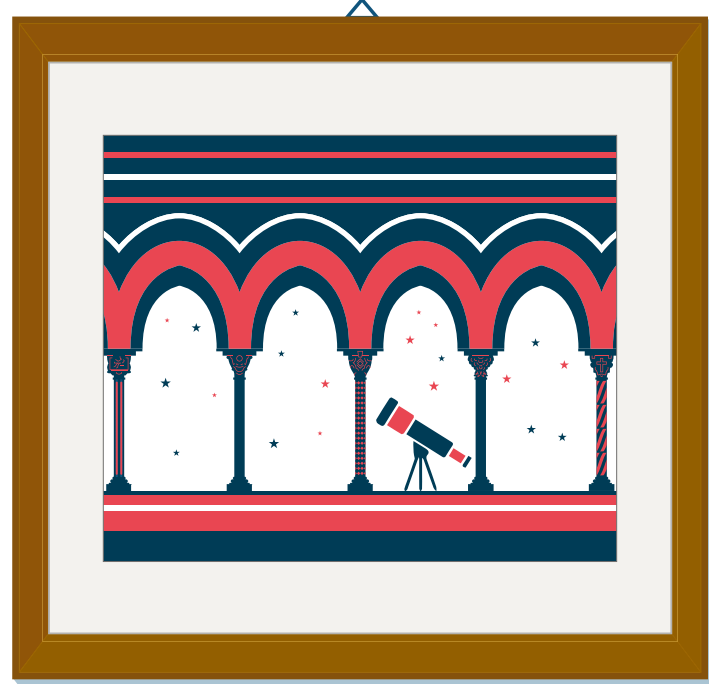
Cattedrale di Santa Maria Nuova Monreale, 1174