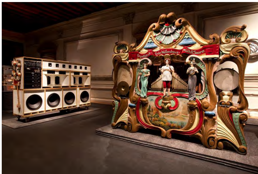
Immagini della mostra 'Art or Sound', Fondazione Prada, Ca' Corner della Regina, Venezia, 7 giugno – 3 novembre 2014.